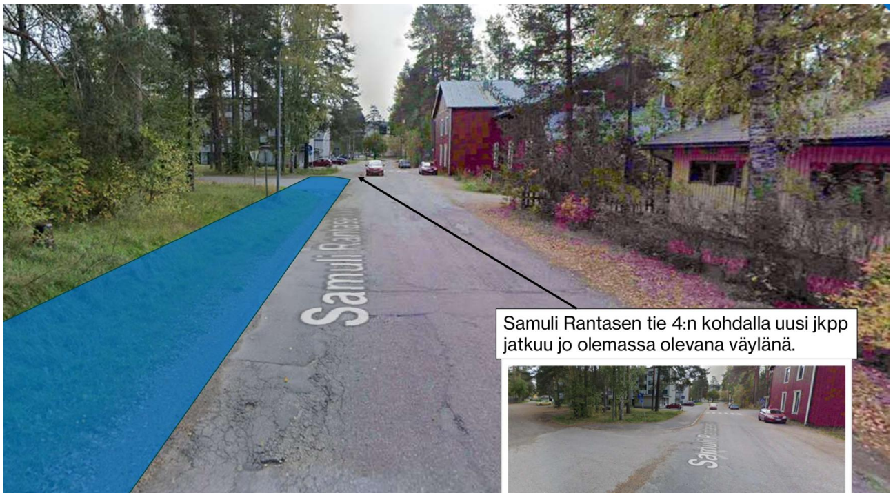
Samuli Rantasen tie 4:n kohdalla uusi jkpp jatkuu jo olemassa olevana väylänä.